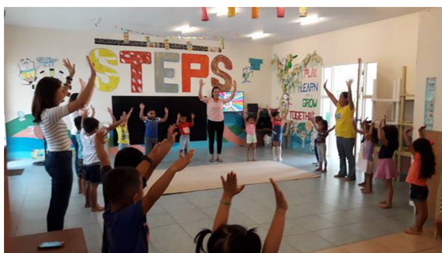
Wenn die kleinen Schüler unruhig werden, setzten wir eine kurze Sportpause ein